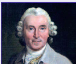
James Lind (1716 - 1794)

... Het duurde 40 jaar voordat de ontdekking van James Lind, dat citroensap scheurbuik kan genezen, geaccepteerd werd.