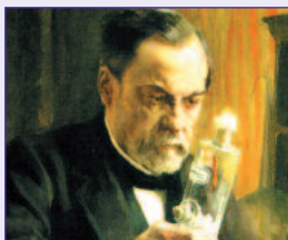
Louis Pasteur (1822 - 1895)

... Als u in die tijd geleefd had, zou u hem dan niet gesteund hebben?