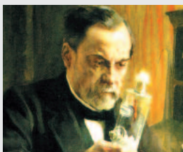
Луи Пастер (1822 - 1895)

... понадобилось четыре десятилетия, прежде чем было признано открытие Джеймсом Линдом возможности с помощью цитрусового сока лечить цингу; ... за эти годы умерло огромное количество людей; ... чем бы вы могли помочь ему, если бы жили в те давние времена?