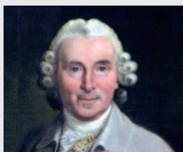
Джеймс Линд (1716 - 1794)

... понадобилось четыре десятилетия, прежде чем было признано открытие Джеймсом Линдом возможности с помощью цитрусового сока лечить цингу; ... за эти годы умерло огромное количество людей; ... чем бы вы могли помочь ему, если бы жили в те давние времена?