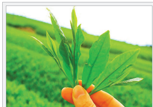
Grüner Tee enthält große Mengen an Polyphenolen, denen zahlreiche gesundheitsfördernde Eigenschaften zugeschrieben werden.

Diese wichtigen Ergebnisse unseres Forschungsinstituts haben wir in mehr als 80 wissenschaftlichen Studien veröffentlicht.